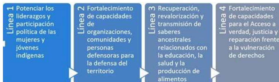
Ilustración 1. Líneas de acción del proyecto

Estas líneas de acción tienen concordancia con el objetivo general y específico del proyecto y su marco lógico cuyos resultados se alinean al análisis del contexto y la decisión orgánica de la CONAIE que determina el alcance de la contribución del proyecto a su Plan de Gobierno en relación con: