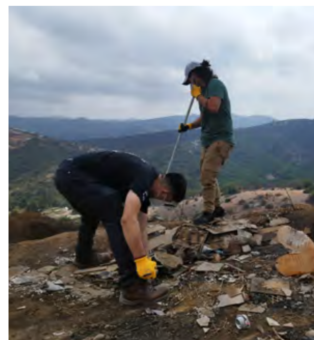
01. Personas defensoras del medio ambiente

Desde sus inicios, Modatima se ha destacado por su compromiso con la defensa de los derechos de agua entre las comunidades más vulneradas