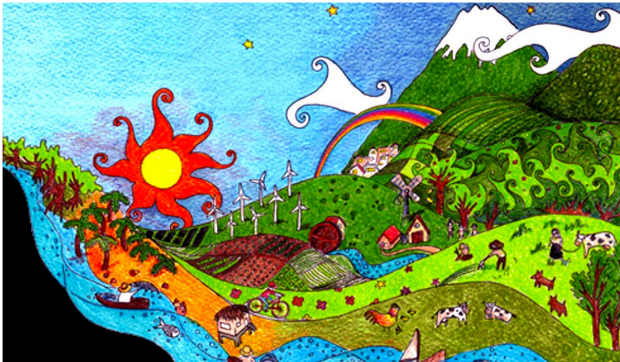
Ilustración: Archivo de Acción Ecológica