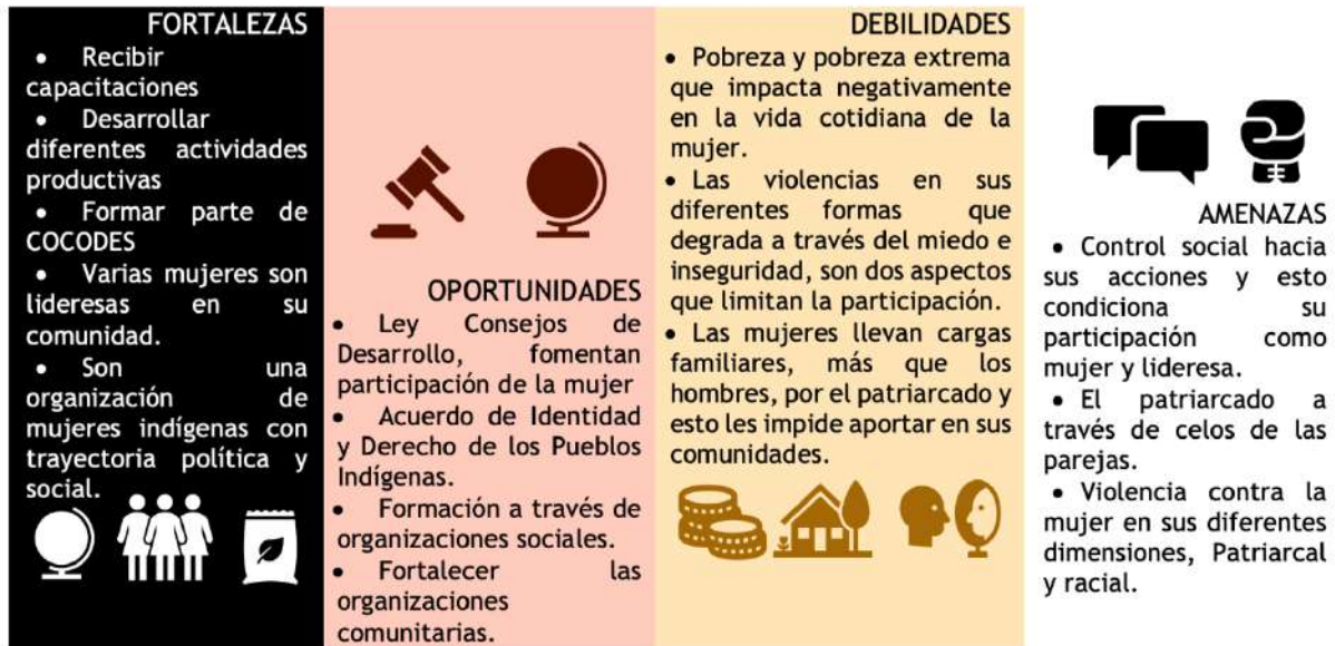
Figura 3. Análisis FODA de participantes k'iche' de nivel Aj.