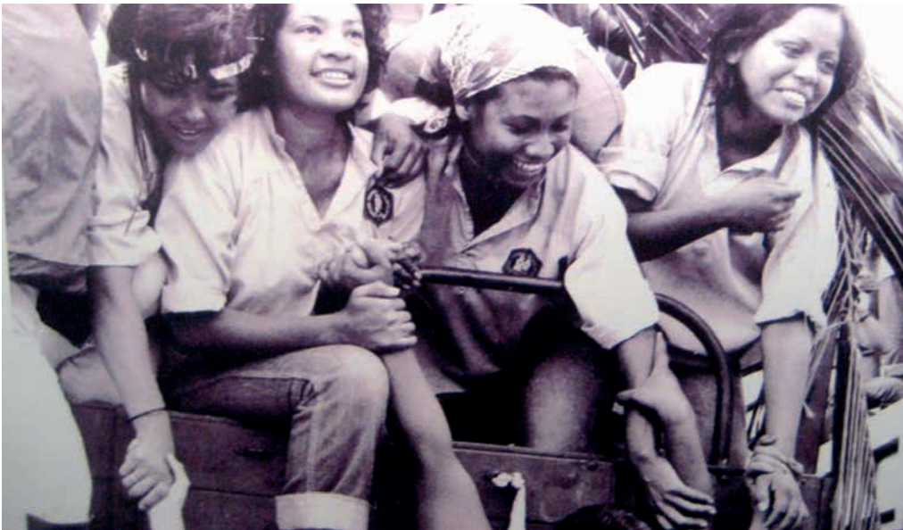
1980: Joves de Managua partint per a la Croada d'Alfabetització

a Amèrica Central, sinó també el que ens estava passant al nostre país. Una generació d'activistes començava a digerir la frustració de les expectatives que havien alimentat en la lluita contra la dictadura franquista, que anaven molt més enllà de poder votar cada