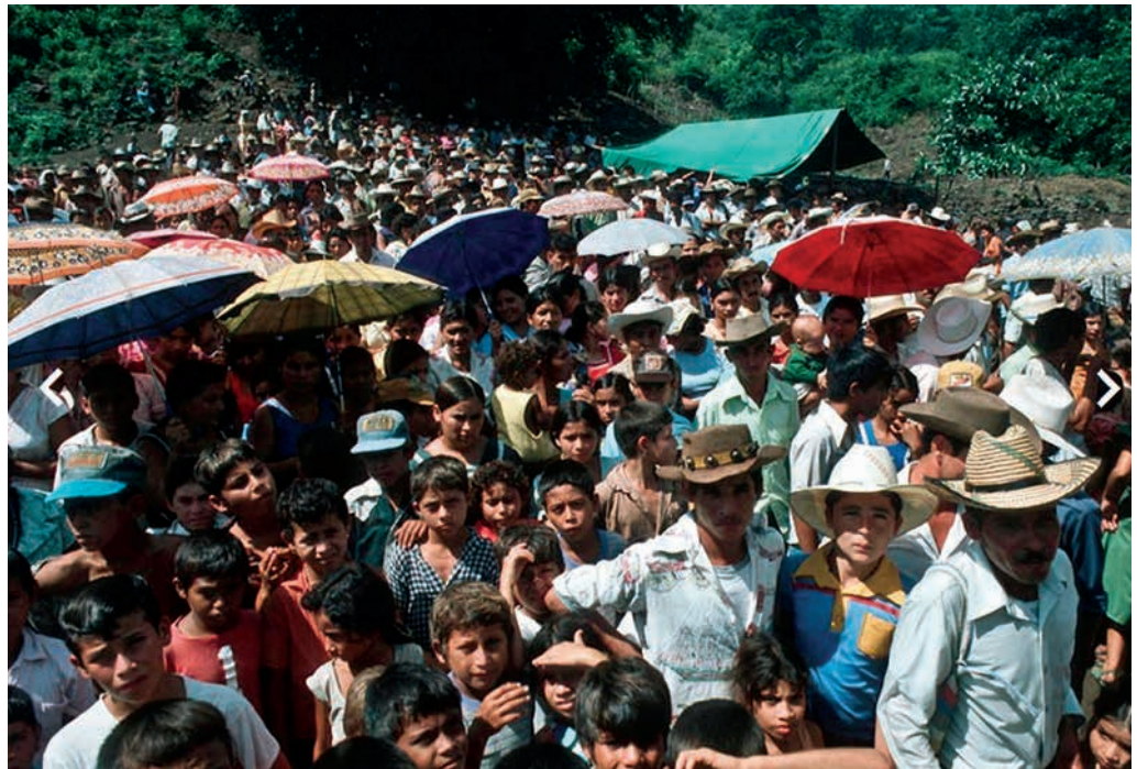
Comunitats salvadorenques arriben al refugi de Colomoncagua (Hondures)

per cert, Berta Càceres va aprendre les primeres lletres de la paraula solidaritat donant suport a les comunitats salvadorenques refugiades a la seva terra; a les muntanyes i les selves guatemalenques del Quiché o els camps de refugi de Campeche, Chiapas o Quintana Roo -Mèxic-. Gent de totes les professions, estudiants i, especialment, gent dedicada a l'ensenyament o la sanitat..., gent solidària que volia ajudar aquells pobles a empènyer un nou món, ja que no s'havia aconseguit aquí.