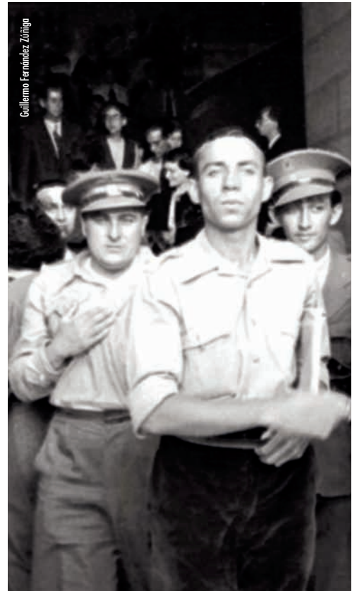
Miguel Hernández saíndo do Congreso de escritores, Valencia

Nacían dunha mobilización xeralizada e esta, dunhas sociedades rurais altamente politizadas, organizadas e cultivadas. Onde imperaba a tensión e fe na política liberadora. Onde as organizacións obreiras e campesiñas extendían os seus ateneos de formación e unha vila podía ter tres, catro ou cinco publicacións semanais de grande calidade, divulgativas e mobilizadoras. Onde a Institución Libre de Enseñanza, a escola Moderna e os krausistas xeraran unha revolución pedagóxica que (ademais de fermentar aquelas xeracións literarias e científicas das que aínda nos alimentamos) expandiu unha edu-