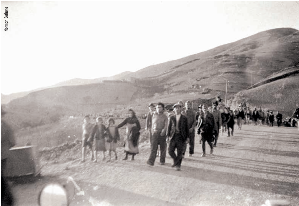
A “Desbandá” de Andalucía fuxindo do terror franquista

Cando acabaron de comer, a gente, os nenos e nenas, persoas maiores, xente de Minglanilla e refuxiada, viron a comitiva, os coches, achegáronse á praza e empezaron a cantar... A partir dese intre xerouse un encontro multitudinario, plural e colectivo na praza convertida nun verdadeiro foro, o primeiro momento do Congreso fóra de guión e con protagonistas reais da loita e do sufrimento. Mulleres, homes e rapazada de todos os continentes e con diversas linguas,