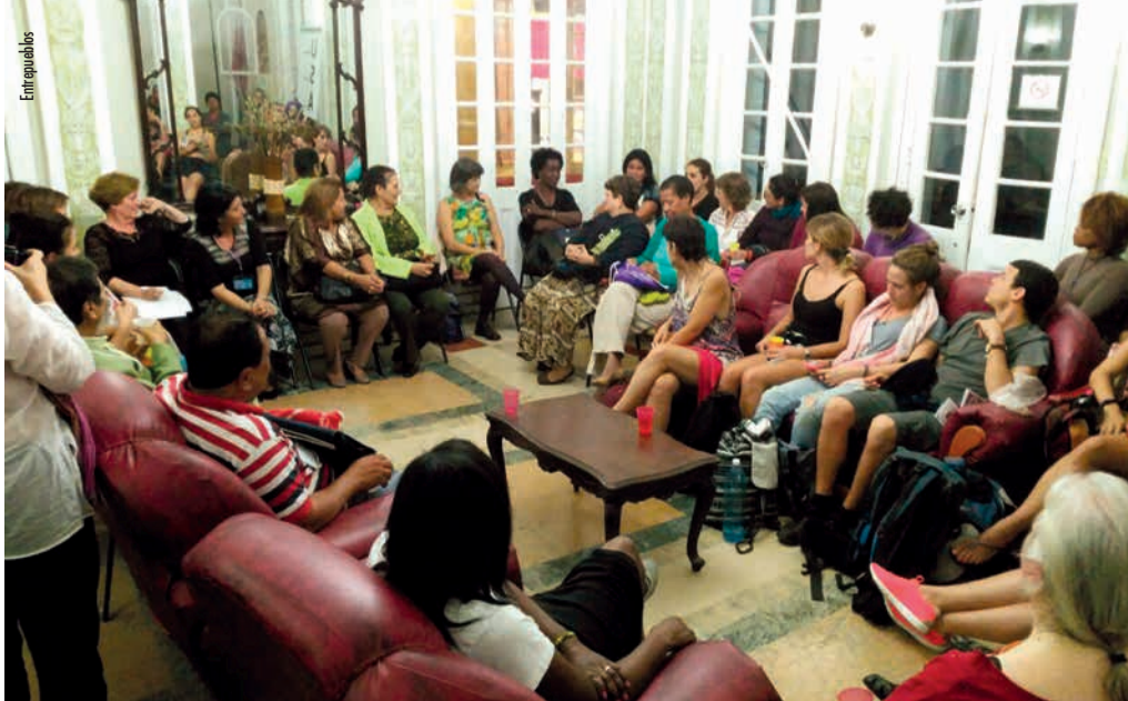
Reunión sobre feminismos no Instituto de Filosofía

en todo o continente latinoamericano e no mundo. De novo, máis unha vez, en Paradigmas puidemos comprobar como Berta é símbolo de moitas revolucións, a súa figura representa moitas loitas, as loitas indíxena, ecoloxista e feminista.