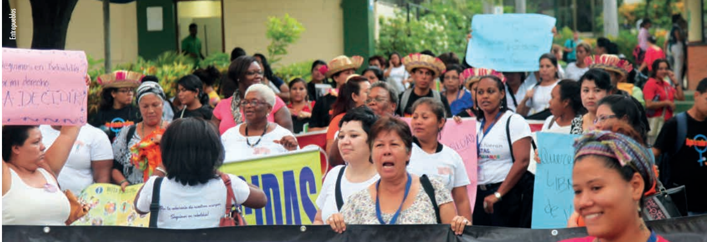
Encontro mesoamericano polos dereitos sexuais e reprodutivos, Managua

países ou as institucións multilaterais. Para o caso dos doantes bilaterais, posiciónase con maior relevancia o nivel de comercio que teñen cos receptores, o que suxire que a axuda ten como obxectivo fortalecer os vínculos comerciais. O modelo de eficacia amosa que non existe unha relación significativa entre o peso da axuda dentro de cada país da rexión e as taxas de crecemento que estes rexistran. Isto non ten que ser interpretado como unha chamada a cesar toda fonte de axuda; é unha invitación a repensar as cousas». 3