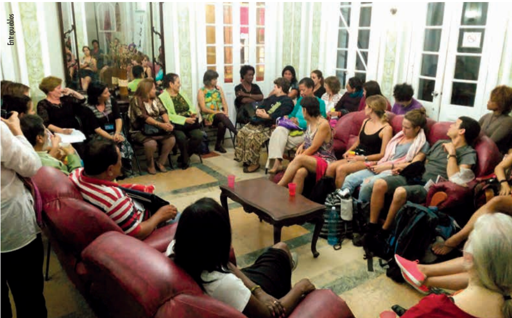
Reunió sobre feminismes a l'Institut de Filosofia, La Habana

figura representa moltes lluites, les lluites indígena, ecologista i feminista.