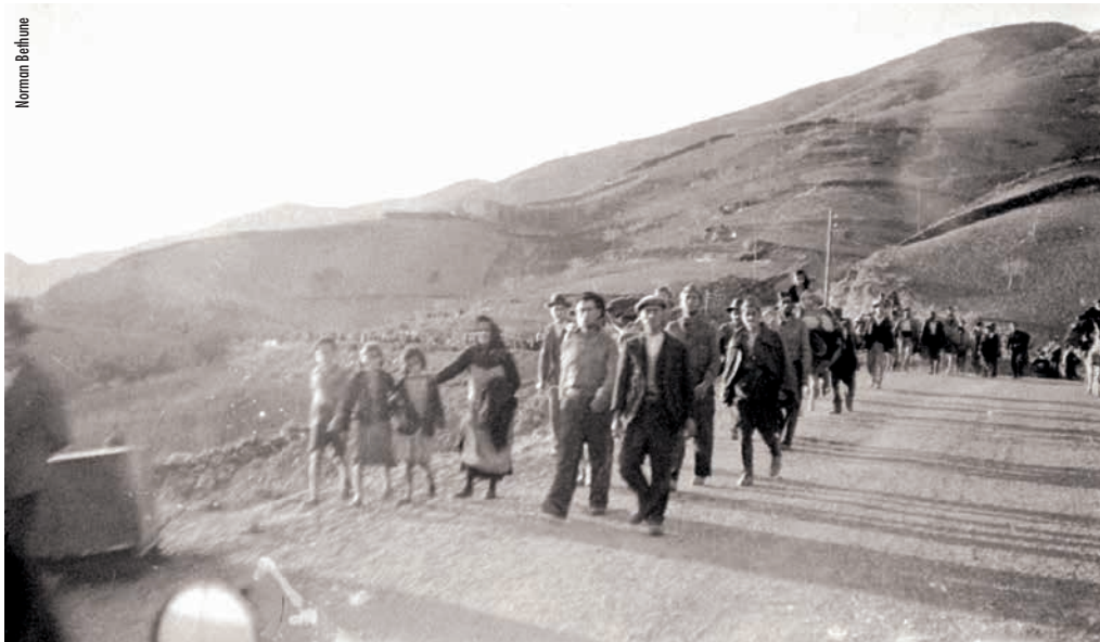
La «Desbandá» d'Andalusia, fugint del terror franquista

Quan van acabar de dinar la gent, els nens i nenes, gent gran, gent de Minglanilla i refugiada, van veure la comitiva, els cotxes, es van acostar a la plaça i van començar a cantar,... A partir d'aquest moment es va generar una trobada multitudinària, plural i colectiva a la plaça convertida en un veritable fòrum, el primer moment del Congrés fora de guió i amb protagonistes reals de la lluita i del sofriment. Dones, homes i infants