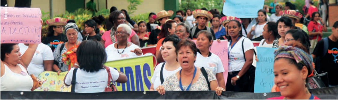
Trobada meso americana pels drets sexuals i reproductius, Managua

de la cooperació dels països o les institucions multilaterals. En el cas dels donants bilaterals, es posiciona amb una més gran rellevància el nivell de comerç que tenen amb els receptors, cosa que suggereix que l'ajuda té com a objectiu enfortir els vincles comercials. El model d'eficàcia mostra que no existeix una relació significativa entre el pes de l'ajuda dins de cada país de la regió i les taxes de creixement que aquests registren. Això no ha d'ésser interpretat com una crida a aturar tota font d'ajuda; és una invitació a repensar les coses» 3 .