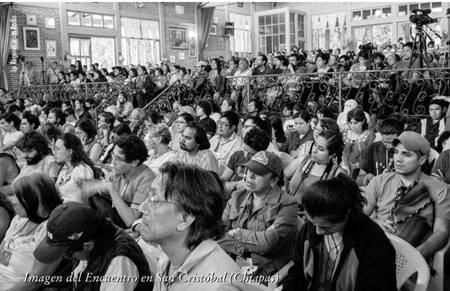
Imagen del Encuentro en San Cristóbal (Chiapas)

Urge encontrar la manera de que otros colectivos puedan visitar Chiapas y acudir al llamado del «caracol» para andar el mundo. ■