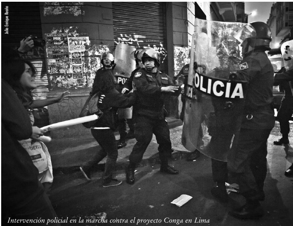
Intervención policial en la marcha contra el proyecto Conga en Lima