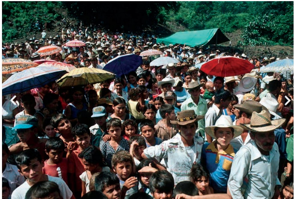
As comunidades salvadoreñas chegan ao refuxio de Colomoncagua (Honduras)

e Mesa Grande (Honduras), onde, por certo, Berta Cáceres aprendeu as primeiras letras da palabra solidariedade apoiando as comunidades salvadoreñas refuxiadas na súa terra; nas montañas e selvas guatemaltecas do Quiché ou os campos de refuxio de Campeche, Chiapas ou Quintana Roo –México–. Xente de todas as profesións, estudantes e, especialmente, xente adicada ao ensino ou a sanidade..., xente solidaria que quería axudar a aqueles pobos a pular por un novo mundo, xa que non se tiña conseguido aquí.