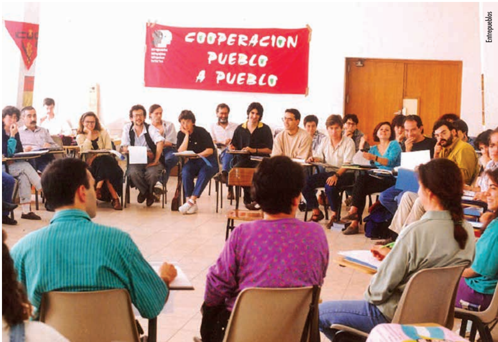
Asemblea de Entrepobos 1990

Os procesos de paz en Centroamérica, con diferentes matices, cambiaron cousas, para que non cambiara nada. Custou dixerir as derrotas e as autoderrotas dos procesos revolucionarios. E unha organización como Entrepobos, que nacera no seo dese movemento social internacionalista, tivo que seguir o seu camiño nun diferente contexto, iso si, conservando un funcionamento baseado en organizacións territoriais con persoas activistas dalgúns dos Comités de Solidariedade que sostiveron a súa aposta internacionalista na década neoliberal.