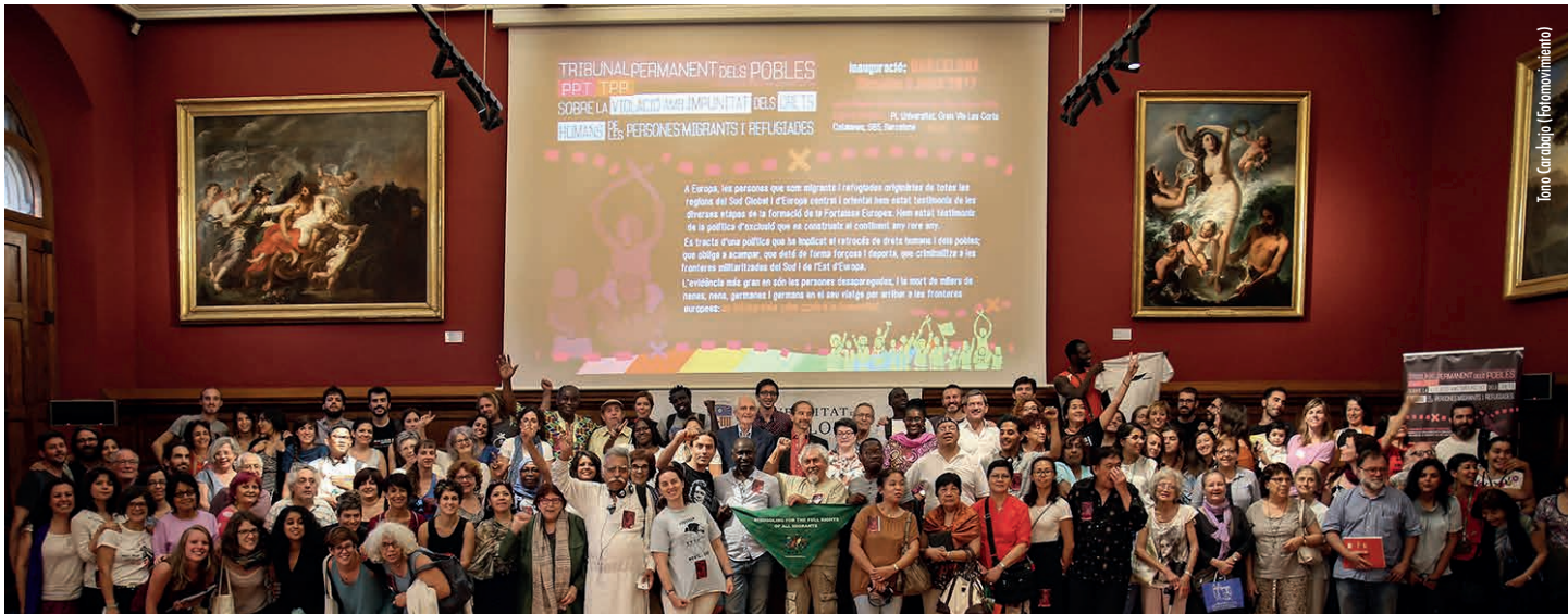
Evento de lanzamento de TPP en Barcelona

O modelo capitalista neoliberal artículase actualmente en torno á criminalidade e á impunidade. Os directivos das empresas transnacionais máis importantes do mundo e da banca internacional reciben todos os honores a pesar do seu papel nas crises financeiras globais e outros desastres que afectan ao planeta.