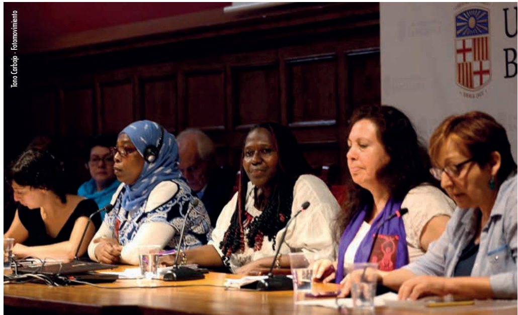
Evento de lanzamento de TPP en Barcelona

Confiamos en que este proceso permitirá empoderar e dar maior visibilidade aos Pobos Migrantes