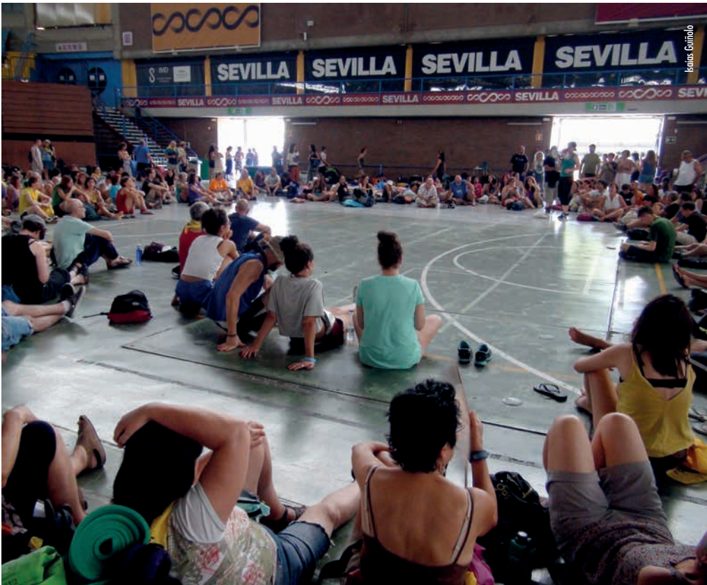
Assemblea de la Caravana a Sevilla

en aigües espanyoles, i que en molts casos s'acudeix a la gendarmeria marroquina, fins i tot estant en aigües de la jurisdicció espanyola; l'abandó de nens i nenes en mobilitat (els mal anomenats MENES, menors no acompanyats) als carrers de Melilla, sense aplicar-los els acords internacionals de l'interès superior del menor; les condicions dels CIE (Centres d'Internament per a Estrangers), on romanen privats de llibertat i en pessimes condicions, persones que no han comès cap delictes; la externalització de fronteres a tercers països (Turquia, el Marroc) pagant-los moltíssims milions perquè facin el paper brut que els països europeus no volen fer, o els discursos i arguments que fomenten el racisme i la xenofòbia, el menyspreu i el rebuig.