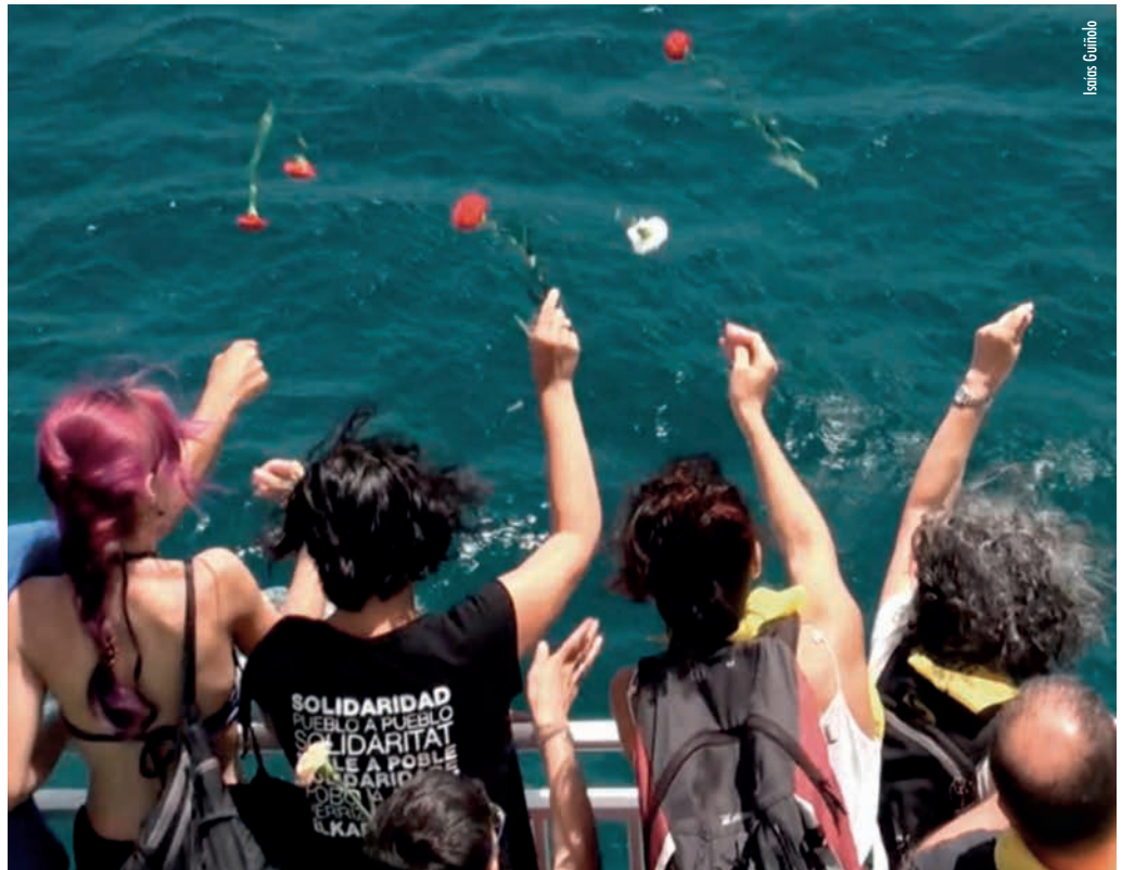
Clavells en memòria dels qui han perdut la vida en el Mediterrani

És necessari trencar aquesta frontera de la indiferència en la qual vivim submergides cada dia als nostres territoris, assenyalar als culpables